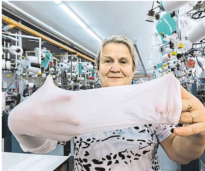
Zásah lidské ruky. Pletací stroje umí vyrobit jen jakousi trubici. Špičky ponožek, podkolenek a punčoch se musí přišít ručně.